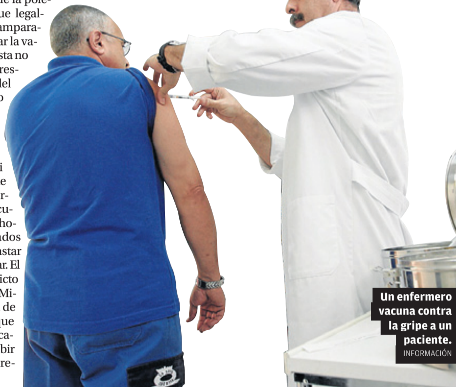
Un enfermero vacuna contra la gripe a un paciente.

La campaña de vacunación arranca el lunes y Sanidad exige que se identifique a quienes no vacunen